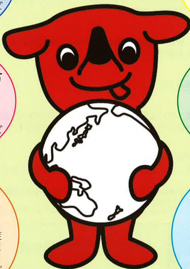
千葉県マスコットキャラクター 「チーバくん」