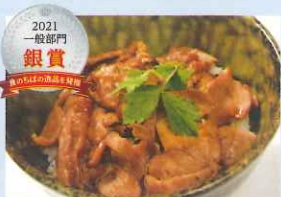
2021 一般部門 銀賞 炭焼き鶏井