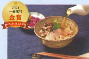
2021 一般部門 金賞 房総真鯛と黄金鱈のお茶漬けセット“彩”