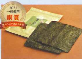
2021 一般部門 銅賞 青飛び(焼き海苔)