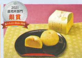
2021 直売所部門 銀賞 船橋名産菓「梨の里」含むお菓子セット