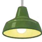
ペンダントライト