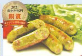
2021 直売所部門 銅賞 花悠 パクチャーウィンナー