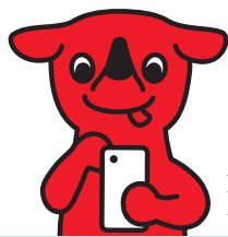
千葉県 マスコットキャラクター チーバくん