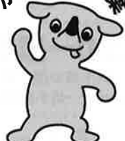
千葉県マスコットキャラクター「チーバくん」